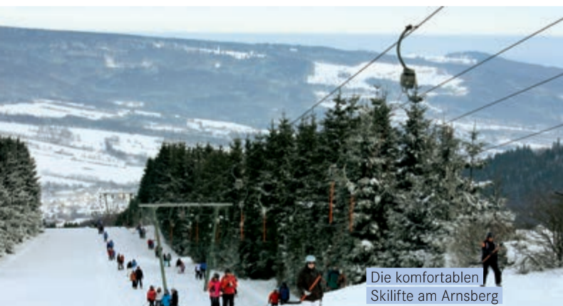
Die komfortablen Skilifte am Arnsberg