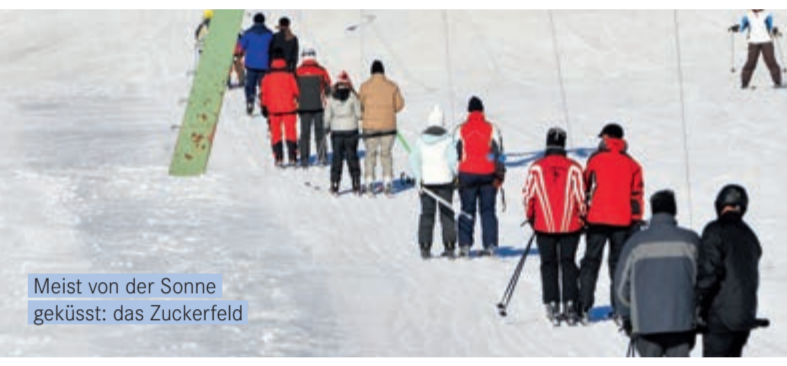
Meist von der Sonne geküsst: das Zuckerfeld