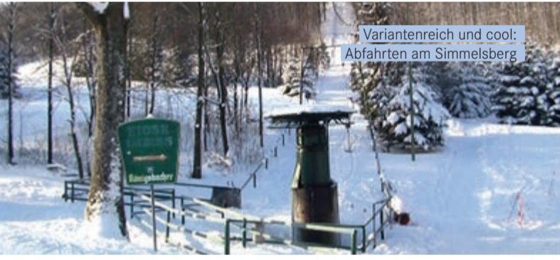
Varianteinreich und cool: Abfahrten am Simmelsberg